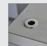
Clamp for lamp Attacco per lampada

Accessories upon request Accessori su richiesta