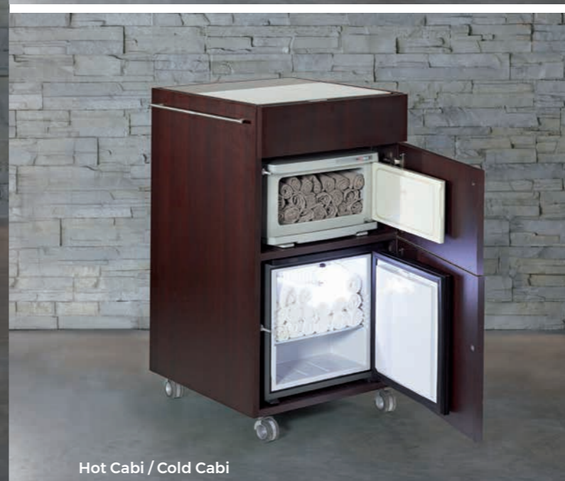
Hot Cabi / Cold Cabi