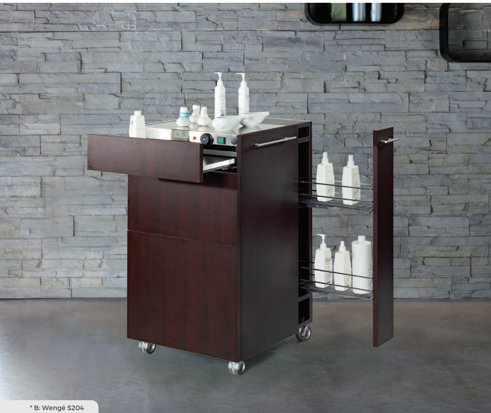
* B: Wengé S204